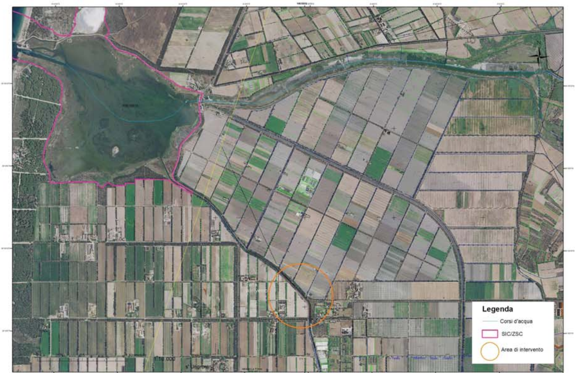
AREA VASTA SU ORTOFOTO 1:10.000